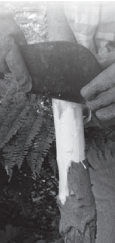
Met een hiepje wordt de esdoorn geringd