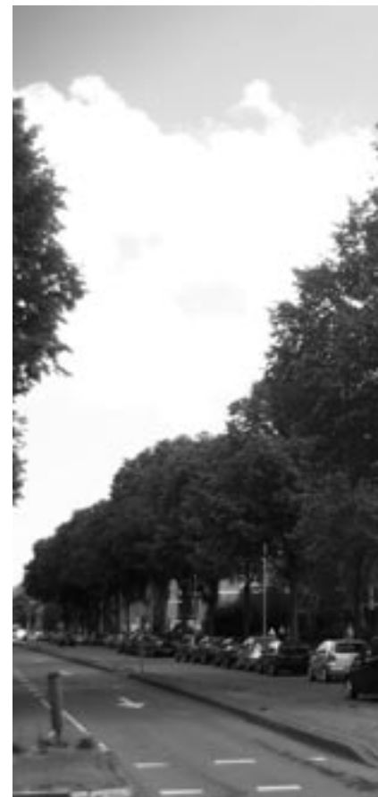
Groen van Prinstererlaan

In oktober vorig jaar werd een kapaanvraag gepubliceerd voor 30 bomen aan de van Maerlantlaan in Moerwijk. Het betreft hier de herinrichting van een plantsoen met speelvoorzieningen, waarbij 30 van de