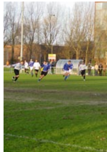
Sportterrein wordt ingeruild voor woningbouw