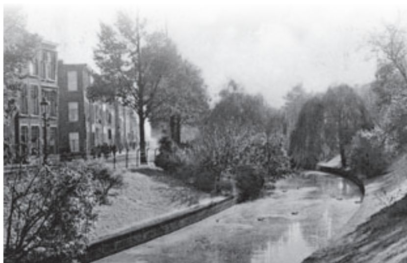
De Valkenboskade gezien vanaf de Thomsonlaan met links de hoek van de Cederstraat (1935). Dit gedeelte doorsneed de Dekkersduinen.

Zo maar een vaart met wat struiken en bomen tussen de huizenrijen. Wat is daar nu over te vertellen? De Valkenboskade verwijst ons naar een interessante fase in de verstedelijking van westelijk Den Haag. En water in de stad is altijd een verrijking.