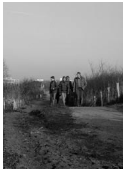
Wandelen tussen de hekken in de Puinduin

Tegelijkertijd blijven we in gesprek met de gemeente en proberen we ook langs die weg steun voor ons gebiedsconcept te krijgen. Zij zouden de publieke partner kunnen worden! ♦