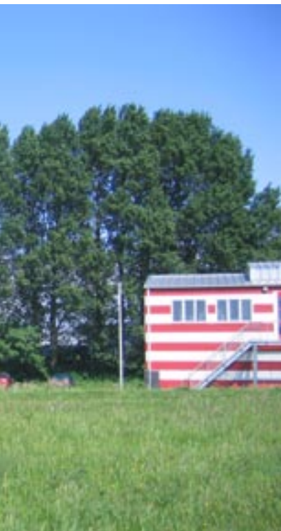
Populieren aan het Ilsyplantsoen in Ypenburg