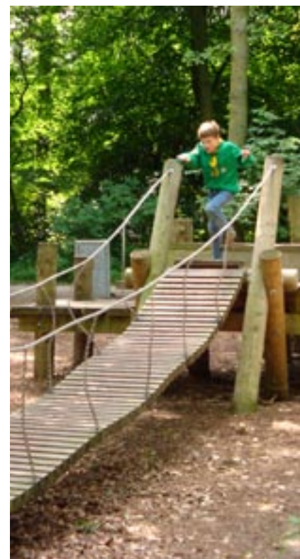
Robin Hood speelbos

eerd stadspark. De laatste decennia is het Haagse Bos dan ook langzaam aan het veranderen van park naar bos. "Driëntwintig jaar geleden zijn we begonnen om kleine gedeeltes aan de natuur over te laten. De strook rond de Pansloot kwam daar als eerste voor in aanmerking. Het is een natte plek waar de grond erg slap is. De bomen die er omvallen mogen blijven liggen, zolang ze geen gevaar vormen. Nu gaan we ook stroken aan weerskanten van dat perceel aan hun lot overlaten. Die zijn droger en zullen een andere vegetatie opleveren". Natuurlijk bos trekt ook meer dieren aan. Rond de Pansloot broedt bijvoorbeeld de buizerd en af en toe worden reeën in het bos gesignaleerd, die via de groene corridor uit de duinen komen. Die ruige bospercelen worden door de bezoekers gewaardeerd, blijkt uit de enquête die SBB met enige regelmaat houdt. Ze zijn ontoegankelijk, maar hebben vanaf het pad meer belevingswaarde. Die waardering is het grootst bij jonge bezoekers tot 40 jaar. Veel oudere mensen houden meer van netjes en aangeharkt, zoals het vroeger was. De jeugd vindt zijn vertier het liefst in het Robin Hood speelbos, de meest avontuurlijke speelplek van heel Den Haag. ♦