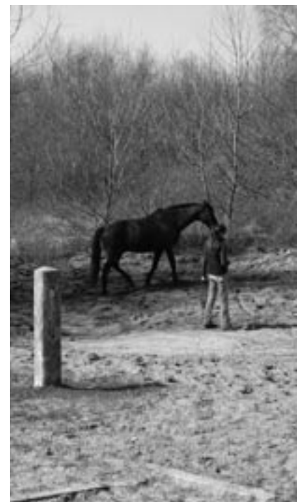
De paardencirkels kennen een grote dynamiek en bieden een habitat voor de zandhagedis