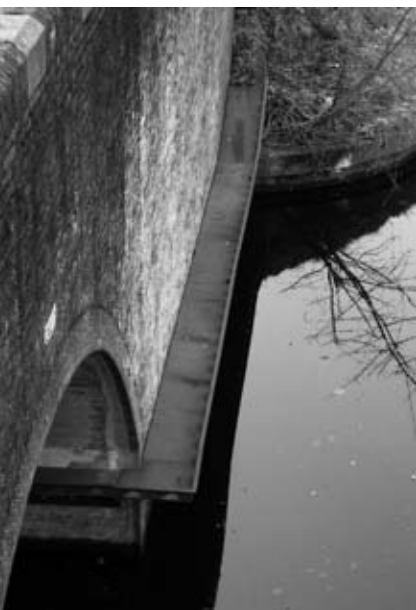
Looprichels onder bruggen geven fauna een kans om de hindernis te nemen

de kaart na pagina 18. Bij de opgaven per masterplan-gebied staan namelijk alleen de bouwplannen, maar de groene opgaven die we net noemden zijn vergeten!