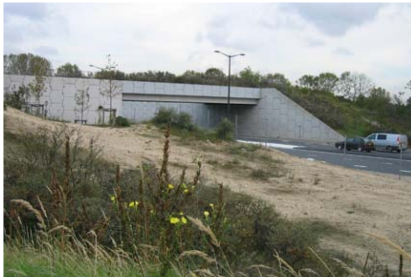
Ecostructuur over de Landscheidingsweg