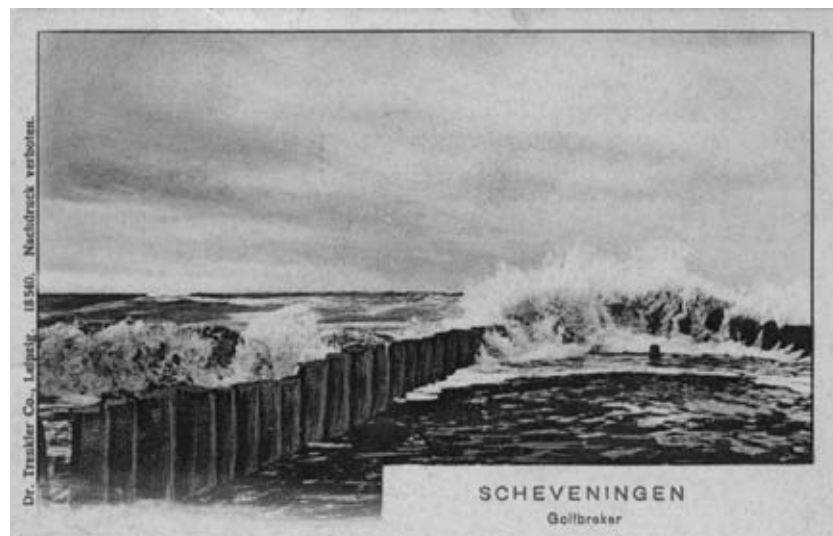
Strandhoofd of golfbreker omstreeks 1900, collectie F. Beekman

Die golfbrekers verrijken het zandstrand met een stukje rotskust. Op de stenen groeien zeepokken, mos-