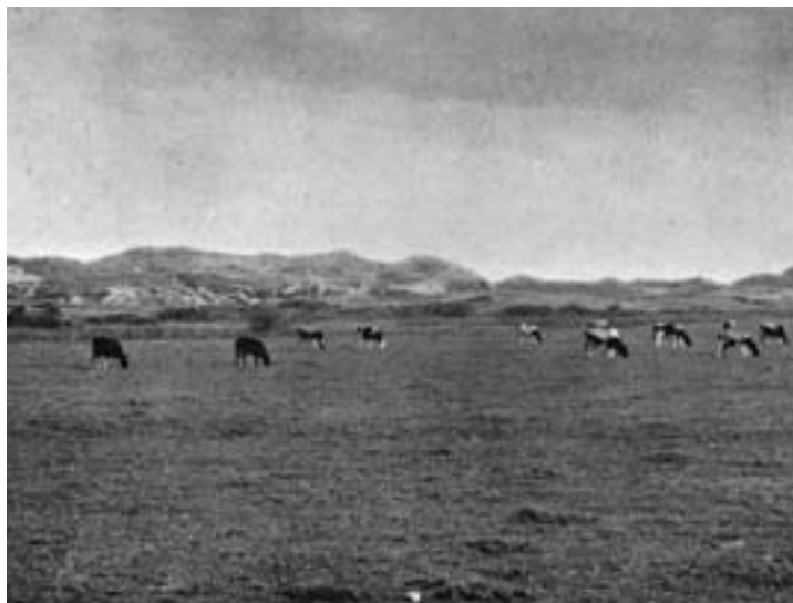
Grazende koeien in de Segbroekpolder bij Kijkduin met de hoge kustduinen op de achtergrond (1910).

Aan de Loosduinse kant van de Segbroekpolder liggen de Dekkersduinen met een fraaie begroeiing van struikheide, gaspeldoorn, brem, stekelbrem en steenanjer. Hoogenraad en Van Itersum noemen de plantengroei hier 'klassiek', waarmee ze bedoelen dat het de kenmerkende vegetatie van de ontkalkte Oude Duinen is. In het natuurreservaat Wapendal zijn deze planten nog te zien. Aan de horizon ontwaren we ten slotte de RK-kerk en NH-kerk van Loosduinen en met enige moeite ook het landhuis Ockenburgh.