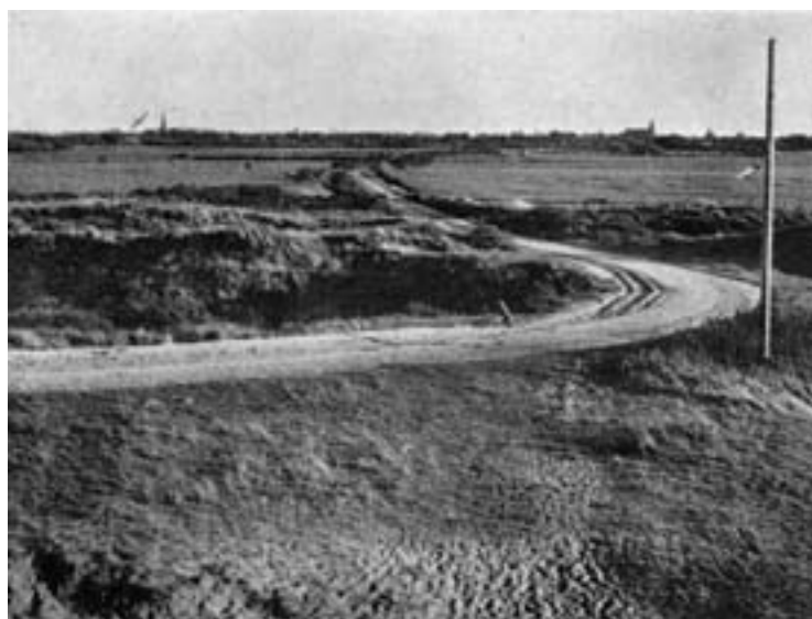
Gezicht op Loosduinen vanaf Kijkduin(1910). De Kijkduinsestraat (toen Zeestraat geheten) is slechts een zandweg.