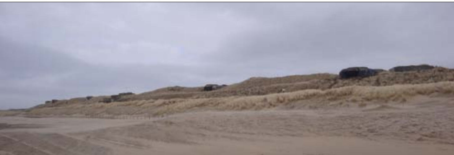
Het bunkercomplex van de Atlantikwall is vanaf het strand goed zichtbaar

tendeels in Wassenaar, dat via Meijndel en Berkheide tot aan Katwijk doorloopt. Tussen en onder de duinen ligt langs de kust een rij bunkers, overblijfselen van de Atlantikwall van de Duitse bezetting in de Tweede Wereldoorlog. Vleermuizen, waaronder de zeldzame meervleermuis, maken er nu dankbaar gebruik van als slaapplek en voor overwintering. Ze zijn erg verstoringgevoelig en daarom moeten die bunkers met rust worden gelaten. Niet iedereen heeft daar oog voor. Een stichting heeft, met steun van de gemeente Den Haag, het plan opgevat om dit bunkercomplex om te vormen tot een historisch museum. Dat zou rampzalig zijn voor het voortbestaan van de vleermuizenkolonie. De AVN heeft samen met andere verenigingen deze plannen scherp afgekeurd en heeft de gemeente op de gevolgen gewezen. Met de natuurbeschermingswetgeving in de hand staan we sterk en de plannen lijken momenteel van de baan. Maar we blijven waakzaam, want met het nieuwe bestemmingsplan Oostduinen blijft 'recreatief medegebruik' zoals dat tot op heden is toegepast toegestaan, en dat zou voor de bunkers inhouden dat er toch enkele bezoeken per jaar mogelijk blijven.