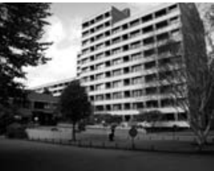
De huidige Flat Arendsdorp

Sinds drie jaar is bekend dat de beide daar aanwezige zorginstellingen in het landgoed willen veranderen. Zowel Florence aan de Goetlijfstraat als Flat Arends-